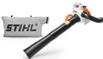
BENZIN-SAUGHÄCKSLER SH 56