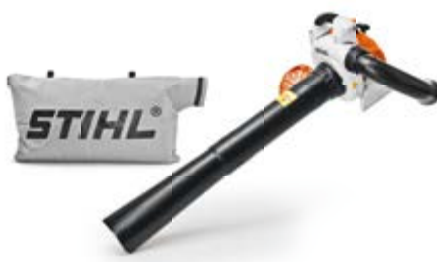
BENZIN-SAUGHÄCKSLER SH 86