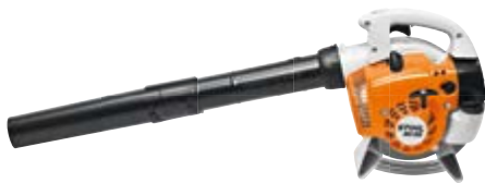
BENZIN-BLASGERÄT BG 56