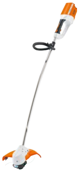
FSA 65 OHNE AKKU UND LADEGERÄT