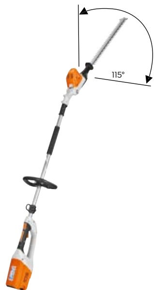
HLA 65 OHNE AKKU UND LADEGERÄT