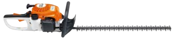
BENZIN-HECKENSCHERE HS 45

Ob Heckenschere, Bläsergerät, Saughäcksler oder Motorsäge mit unseren leistungsstarken Benzin-Geräten sind Sie für jede Aufgabe gerüstet. Wir bieten Ihnen eine große Auswahl an STIHL Geräten. Kommen Sie vorbei, wir beraten Sie gerne.