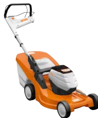
RMA 448 PC OHNE AKKU UND LADEGERÄT